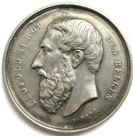
Voor- en achterkant van de medaille van het Landbouwprijskamp van 1876