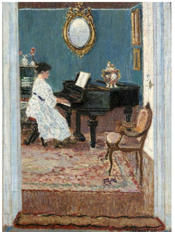
Louis Thevenet, Dame aan de piano , olie op doek, 1921 (privécollectie).