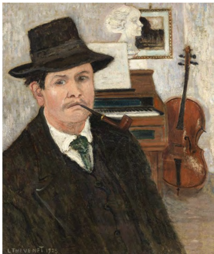
Louis Thevenet, Zelfportret met harmonium , olie op doek, 1925 (privécollectie).

Louis Thevenet werd in 1874 in Brugge geboren en woonde vanaf 1916 in Halle. Hij exposeerde in binnen- en buitenland. Na zijn overlijden in 1930 stond zijn werk regelmatig in de belangstelling. Een groot deel van zijn oeuvre biedt een unieke blik op Halle. Thevenet schilderde de Sollenbeemd en de Arkenvest, de Sint-Martinuskerk (toen nog geen basiliek) en Onze-Lieve-Vrouw, Halse cafés en vele huiskamers. Via verschillende Europese tentoonstellingen zetten deze werken Halle mee op de kaart. Omwille van die verdiensten kende de Stad Halle Louis Thevenet postuum de titel van Ereburger toe. Een achterkleinzoon van Louis' zus Marie kreeg het diploma overhandigd tijdens een feestzitting op 12 februari 2024, Thevenets 150ste verjaardag.