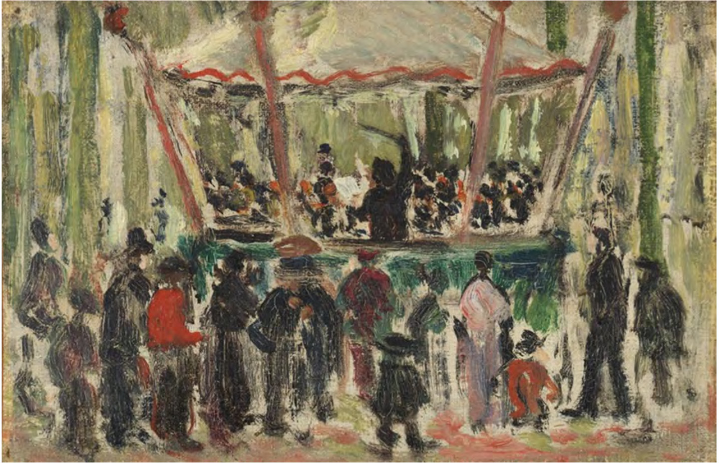
Louis Thevenet, De kiosk , olie op doek, ca. 1927 (Halle, den AST, bruikleen uit privécollectie).

Louis Thevenet hield van eten en was dol op zoetigheden. De lokale producenten inspireren zich hierop voor een tijdelijk aanbod van Thevenet-streekproducten, zoals worst, paté en gebak, een 'Oude Geuze Thevenet' en zelfs een koffie en een speciale Thee-venet. Verschillende ho-recazaken zorgen voor een aangepast Thevenet-arrangement, en in zo'n 85 etalages zijn reproducties van Thevenet te vinden.