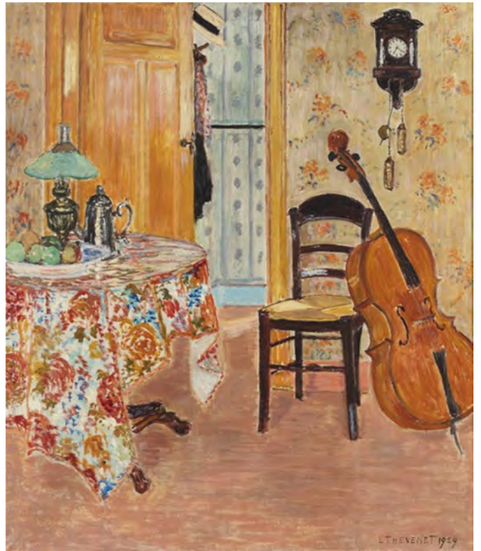
Louis Thevenet, De cello , olie op doek, 1929 (privécollectie).

aankomst in zijn geboortestad overleden, maar zijn naam ging nog regelmatig over de tongen.