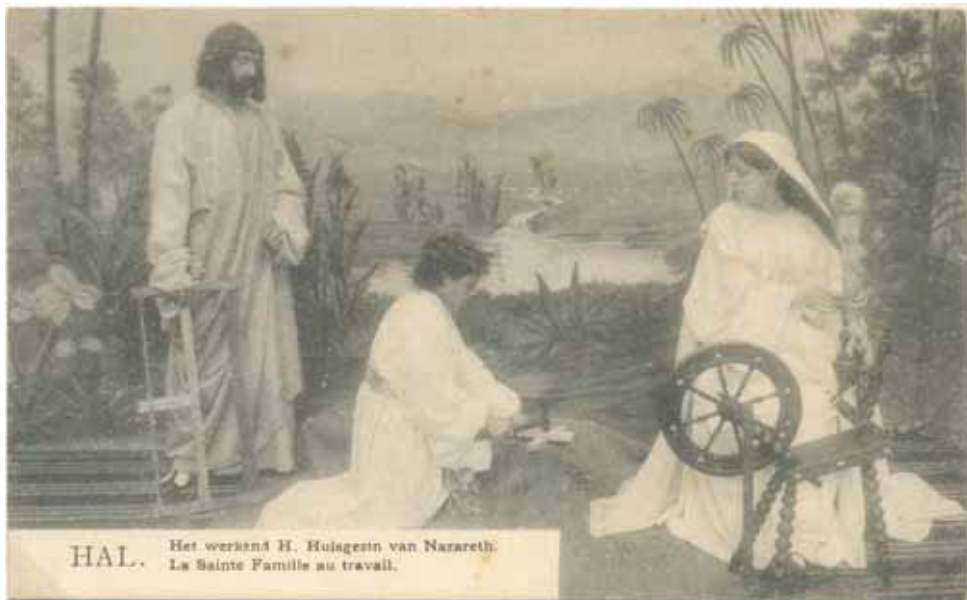
Mariaspel 1910: 'Het werkend H. Huisgezin van Nazareth.'