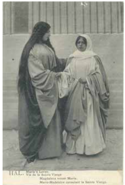
Mariaspel 1910: 'Magdalena troost Maria'.