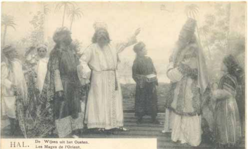
HAL. De Wijzen uit het Oosten. Les Mages de l'Orient.