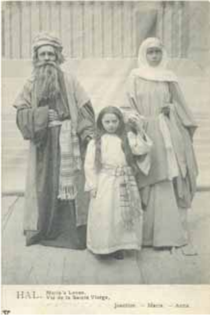
Mariaspel 1910: 'Joachim – Maria – Anna.'

grote machinezaal van de wereldtentoonstelling in Brussel en bood plaats voor 2000 toeschouwers.