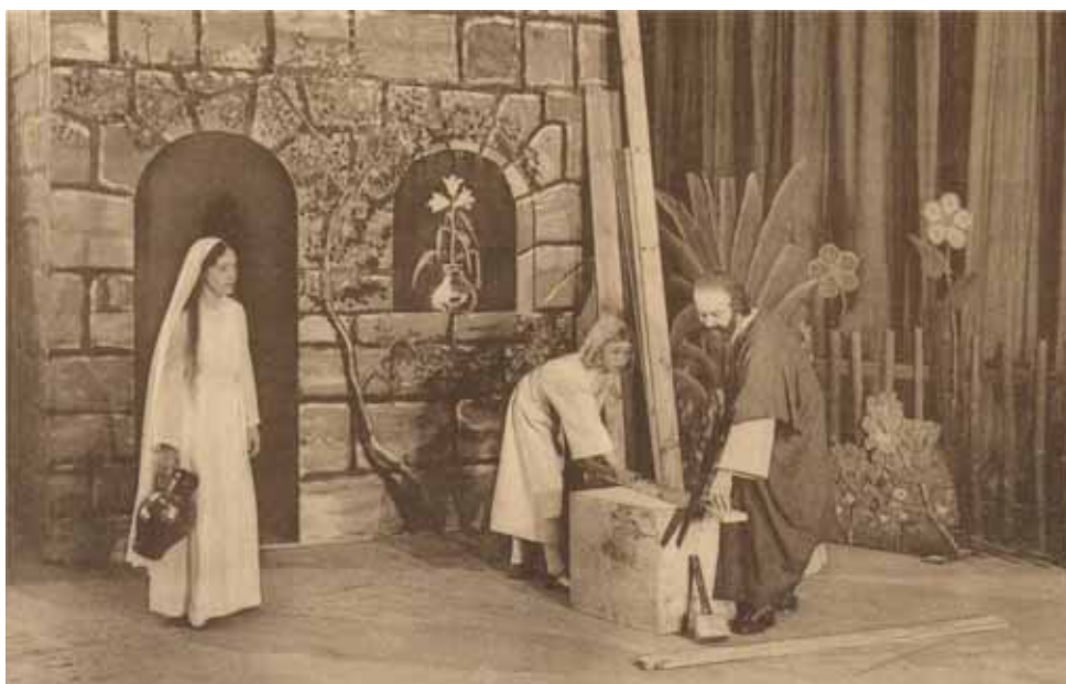
Mariaspel 1935: 'Het huisgezin van Nazareth.'