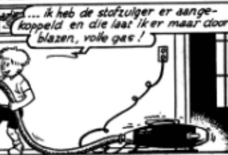
Jommeke door Jef Nys (1956)