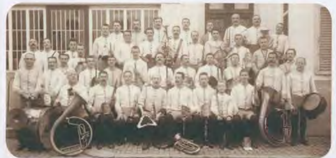
Een foto uit 1898. Naar aanleiding van de viering '100 jaar Boerenkrijg' stapte de harmonie in aangepaste outfit door de binnenstad.

Peter: We werken vrijwillig maar niet vrijblijvend. We hebben een kleine, actieve ploeg die heel goed draait. Het is echt een dagelijks engagement.