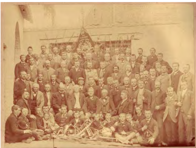
De fanfare in 1895

De fanfare had van in het begin haar typische fanfarevlag op standaard. In 1907 werd een nieuwe vlag vervaardigd naar aanleiding van het predicaat 'koninklijk'. Daarnaast bezat de fanfare een rechthoekig vaandel met wapenschild van Alseberg. Tijdens WO I werden alle repetities, concerten en avondmalen opgeschort. Toch waren er in 1917 127 ereleden en 42 spelende leden. In 1920 werd het 50-jarig bestaan gevierd, er werden nieuwe foto's genomen van alle leden. Vooral tijdens het interbellum groeide het aantal spelers aan: in 1934 waren er 59 spelers en zo'n 187 steunende leden.