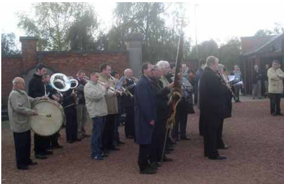
1 november 2005 – Kerkhof Halle