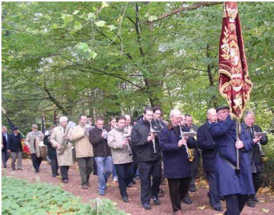
11 november 2005 – in stoet door het Albertpark.