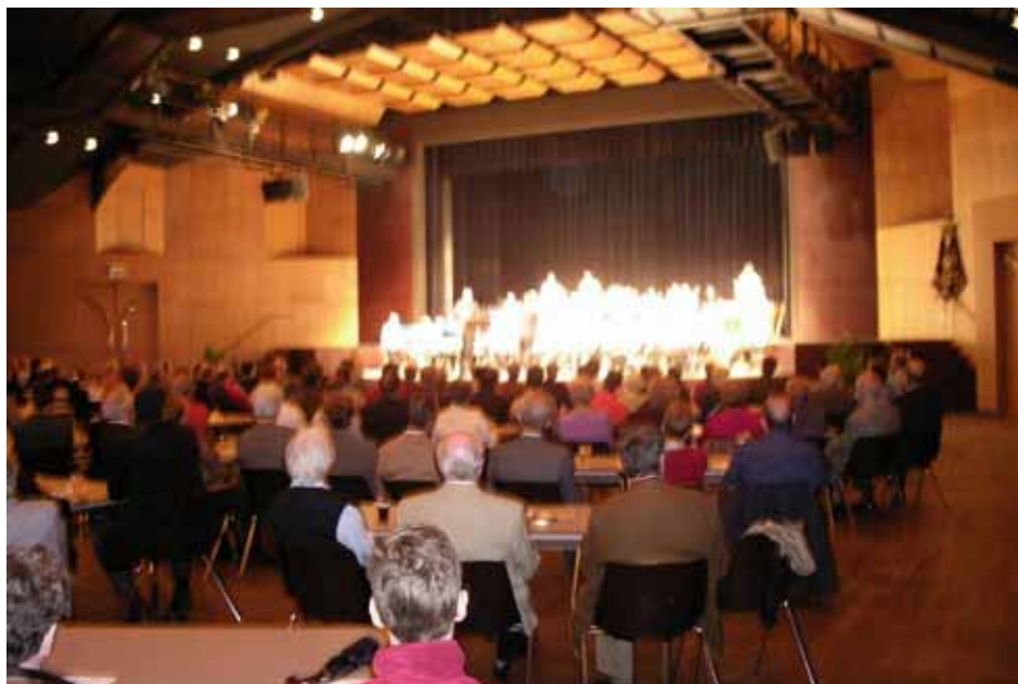
De Harmonie speelde voor een goedgevulde zaal.